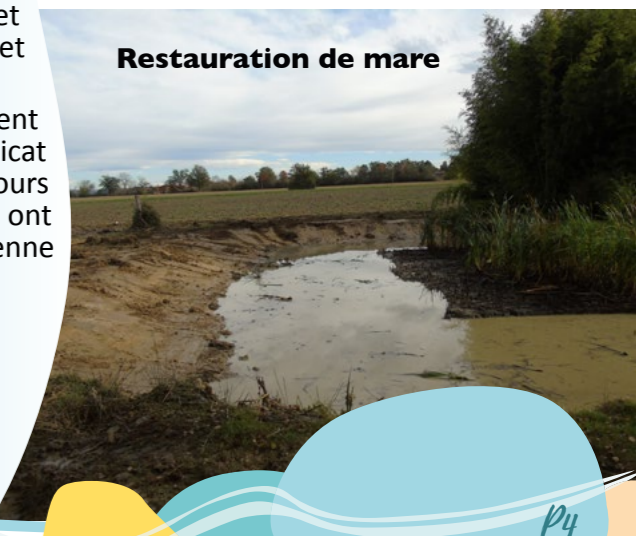
Restauration de mare