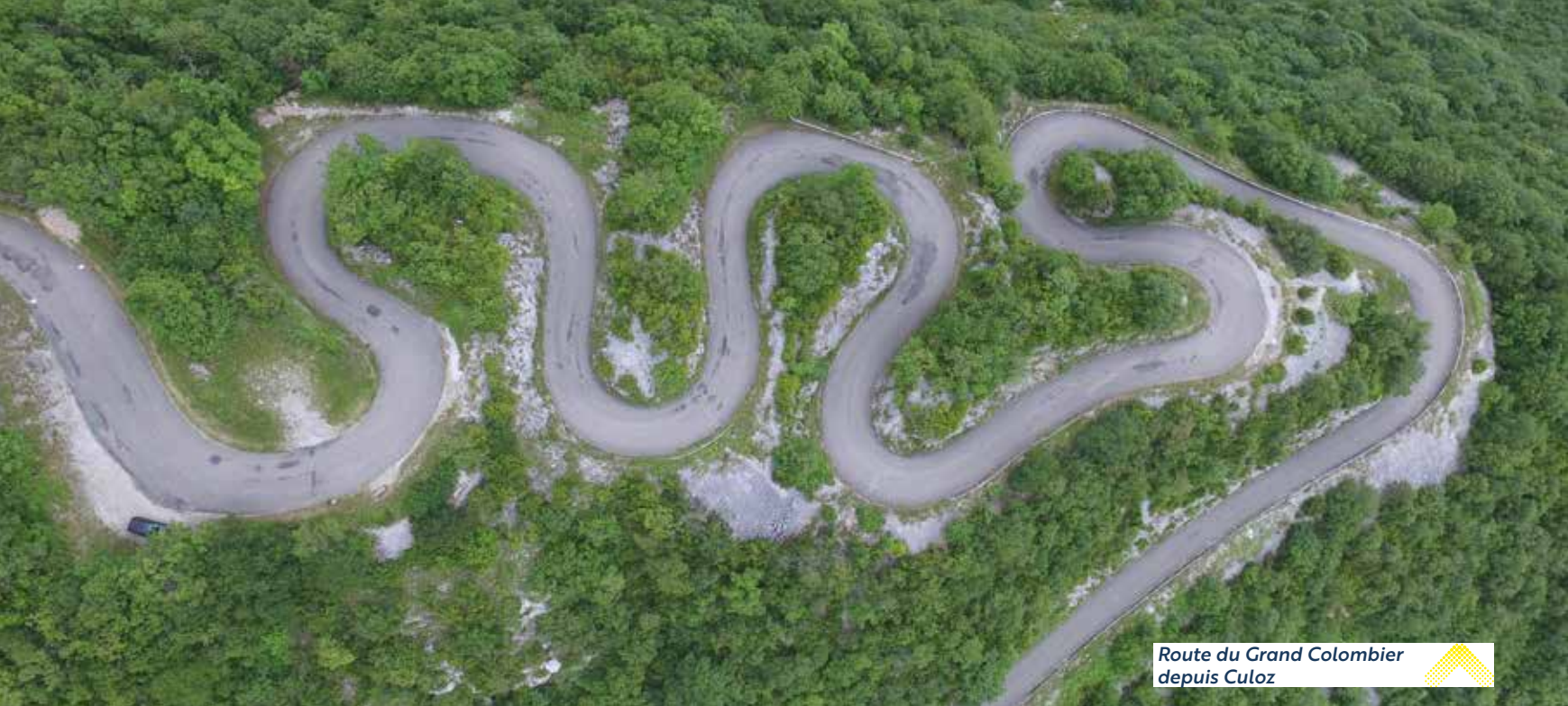
Route du Grand Colombier depuis Culoz

SITE D'EXCEPTION ! Le Grand Colombier culmine à 1534 m d'altitude et offre un panorama exceptionnel : vue à 360° sur la chaîne des Alpes et le Mont-Blanc, sur le Valromey ainsi que sur les lacs du Bourget, d'Annecy et du Léman. Événement sportif et convivial, les « journées cyclo du Grand Colombier » sont aussi l'occasion de réaliser une belle sortie nature !