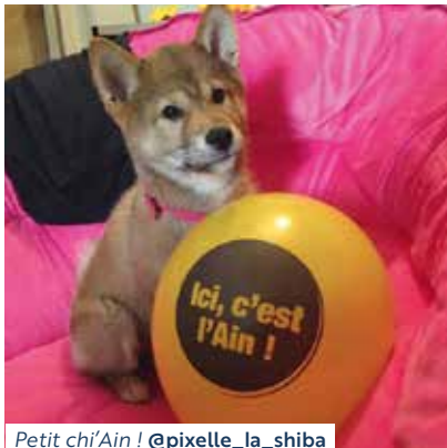
Petit chi'Ain ! @pixelle_la_shiba