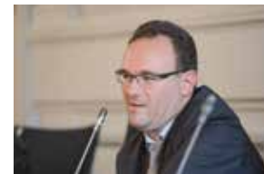
DAMIEN ABAD Président du groupe « L'Ain de toutes nos forces »

Le patrimoine est un atout majeur pour l'attractivité du territoire et son développement touristique. Sachons lui redonner toute sa dimension.