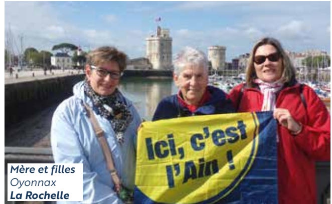
Mère et filles Oyonnax La Rochelle