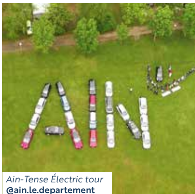
Ain-Tense Électric tour @ain.le.departement