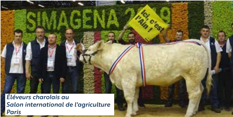
Éleveurs charolais au Salon international de l'agriculture Paris