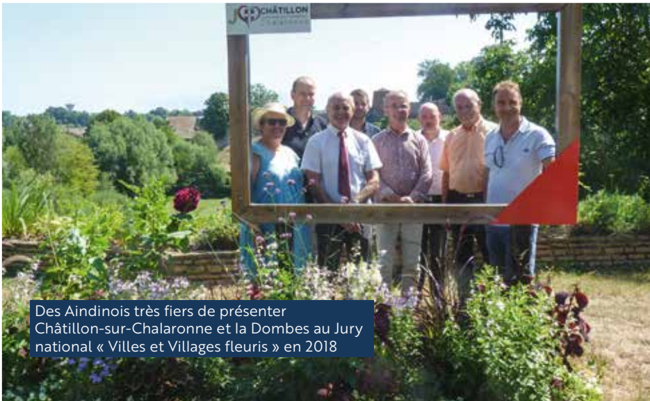
Des Aindinois très fiers de présenter Châtillon-sur-Chalaronne et la Dombes au Jury national « Villes et Villages fleuris » en 2018

L'Ain, classé premier département de la région Auvergne-Rhône-Alpes avec 95 communes fleuries labellisées, figure aussi sur le podium pour les villes « 4 fleurs » et compte la seule commune auralpine primée « Fleur d'or 2018 » : Châtillon-sur-Chalaronne. Aintourisme pourra facilement s'appuyer sur ces bons résultats pour la demande en cours de reconduction du label département fleuri. Ces bons indicateurs saluent l'implication de nombreux Aindinois : les « graines de l'Ain » des écoles élémentaires, les agents des communes et les bénévoles du fleurissement, les particuliers qui embellissent leur maison et même les entreprises et parcs industriels qui participent à la qualité de vie dans notre département. Cet été, suivez les petites fleurs !