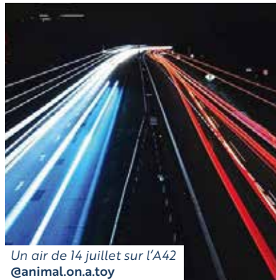
Un air de 14 juillet sur l'A42