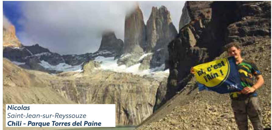
Nicolas Saint-Jean-sur-Reyssouze Chili - Parque Torres del Paine

Sur Instagram, taguez vos photos avec : #icicestlain, nous partageons les plus originales !