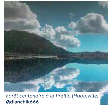
Forêt centenaire à la Praille (Hauteville)