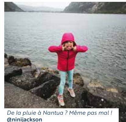
De la pluie à Nantua ? Même pas mal ! @ninijackson