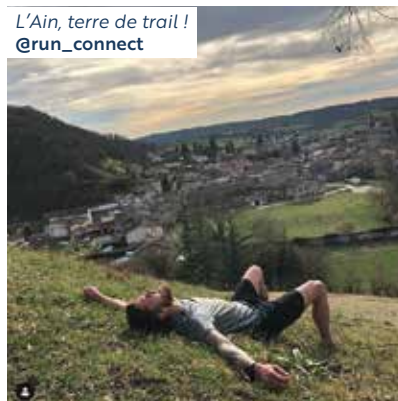
L'Ain, terre de trail ! @run_connect